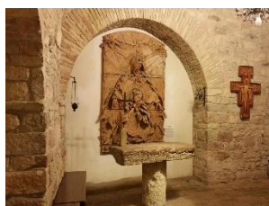
Chiesa Nuova (Wohnort der Familie Francescos)