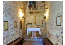
San Francesco Picolino