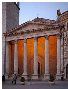
Piazza del Comune