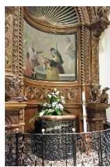
Kathedrale San Rufino (Taufe Franziskus, Clara)