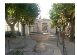
Santa Maria Maggiore – Bischofsresidenz (Francesco trennt sich von seinem Vater)