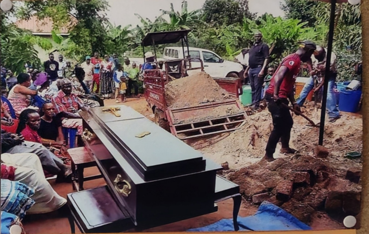
Beerdigungen in Uganda sind mit denen bei uns nicht zu vergleichen. Die Toten werden in unmittelbarer Nähe des Wohnhauses begraben und oft wird die Grube für den Sarg erst während des Gottesdienstes ausgehoben. Und auch die Särge werden meist nicht „mitbestattet“ – die Toten werden meist herausgenommen und die teuren Särge wiederverwendet.