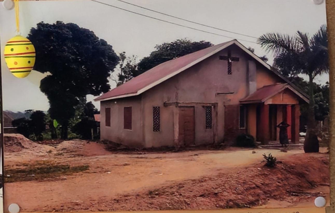
Die Kirche in Saanga ist dem Hl. Maximilian Kolbe geweiht und war schnell zu klein für die immer größer werdende Gemeinde. Daher wurde das Gebäude durch einen Anbau erweitert – aber sie ist schon wieder zu klein für die vielen Gläubigen dort.