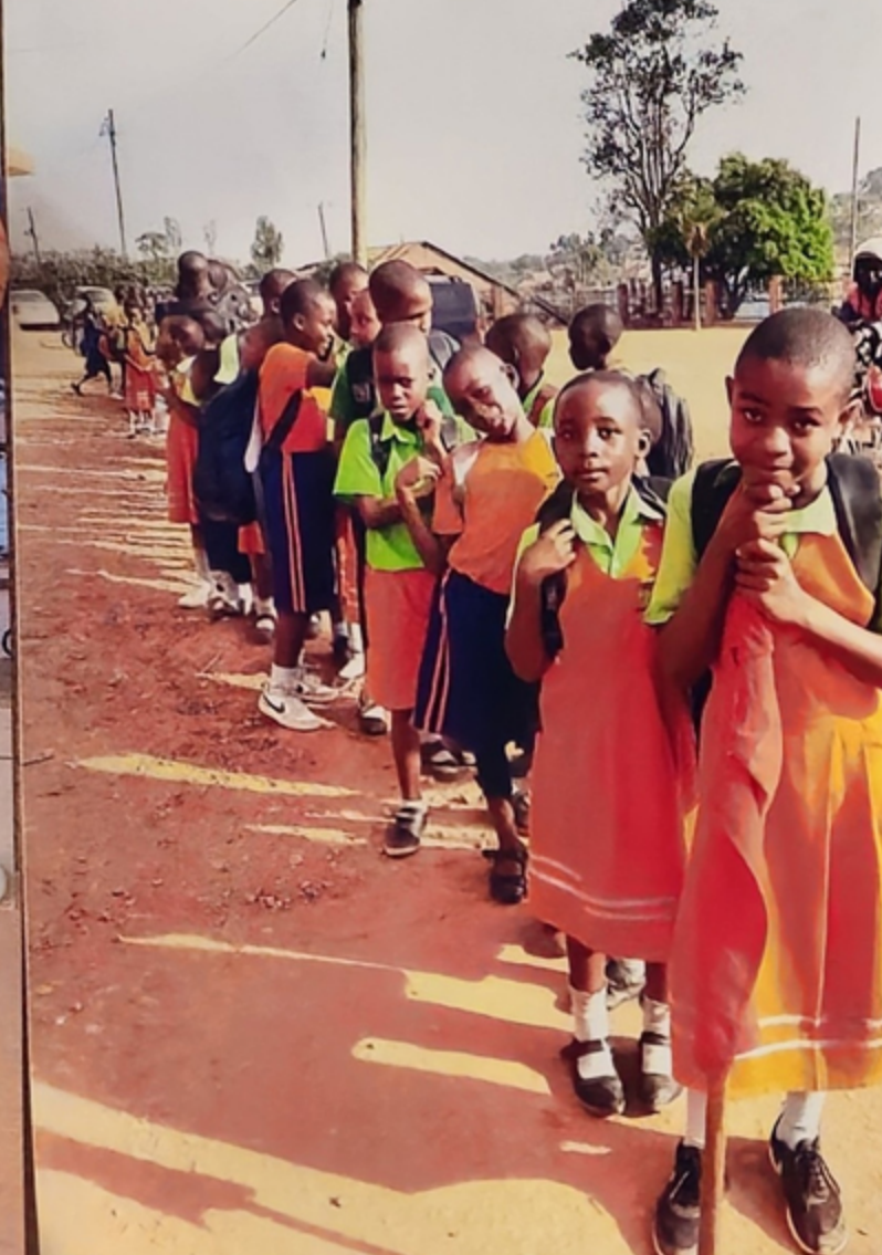
Das Überqueren der Straße in Matugga ist wirklich gefährlich – es herrscht ständig reger Verkehr, Autos, Trucks aber auch unzählige Bod-Bodas (Motorradtaxis) schlängeln sich durch die Autos. Daher warten die Schüler vor dem Überqueren der Straße brav in einer Reihe, bis ein Watchman ihnen über die Straße hilft.