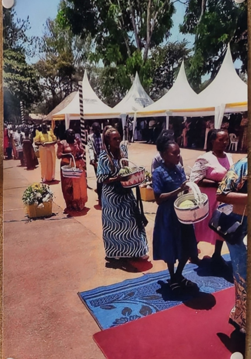
Gabenprozessionen gehören in Uganda zu vielen Sonntagsgottesdiensten. Die von den Menschen gebrachten Gaben (meist Früchte ... oder auch Hühner – selbstverständlich lebendig) sind für das Kloster und die dort lebenden Brüder bestimmt.