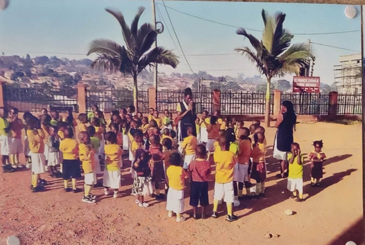
Auch die ganz Kleinen – die so genannte „Babyklasse“ – beten am Morgen, bevor sie mit dem Schulunterricht beginnen. Die älteren Schüler machen das selbstverständlich auch.