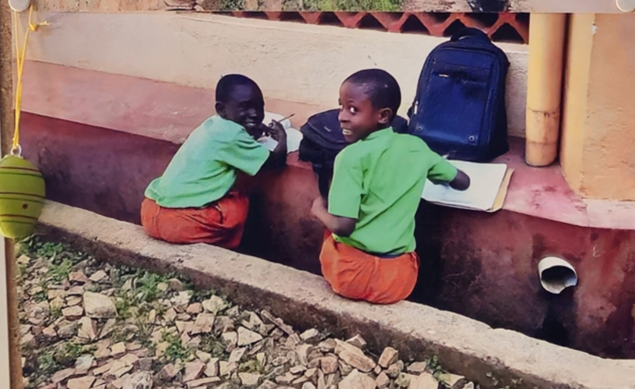
Genau wie uns machen manche Schüler noch schnell vor Unterrichtsbeginn ihre Hausaufgaben und hoffen, dass sie ihr Lehrer dabei nicht erwischt.