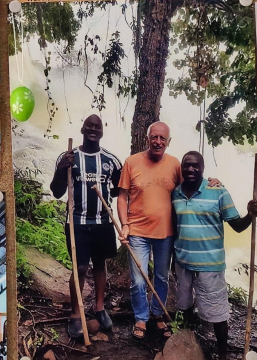
Bei der Gelegenheit machte P. Stanislaus auch einen Ausflug mit ein paar Mitbrüdern zu einem nahegelegenen Wasserfall.